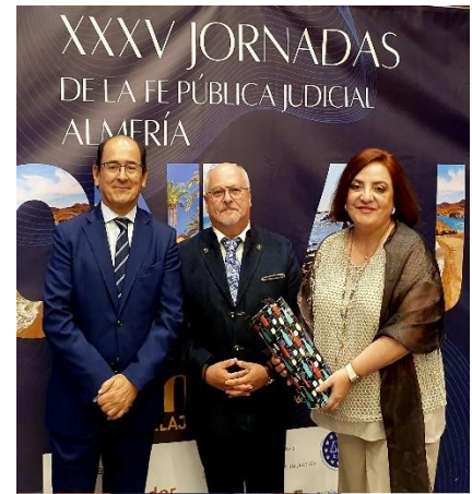
Con el Presidente de la EUR en las Jornadas de Almería.