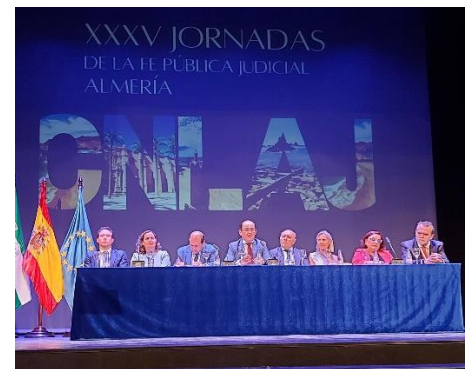
Intervención ante la Junta Nacional en el Congreso de Almería

Durante este tiempo ha participado activamente en todas las publicaciones, jornadas y congresos del Colegio. Ha impartido cursos de naturaleza procesal, especialmente dirigidos a Letrados de la Administración de Justicia y Funcionarios de los Cuerpos Generales.