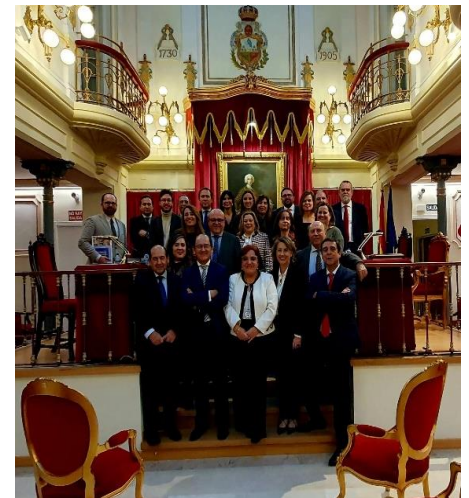
Imagen de la nueva Junta Nacional reunida el pasado día 20 de febrero en la Real Academia Española de Legislación y Jurisprudencia.

Por eso me gusta mucho realizar actividades físicas como el ciclismo, tanto de montaña como de carretera, y el running. Participo en carreras populares y en algunas medias maratones todos los años. Mi próximo reto es la media maratón de Salamanca.